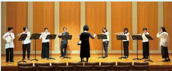
フルートアンサンブル講座「第17回(2024)発表会」