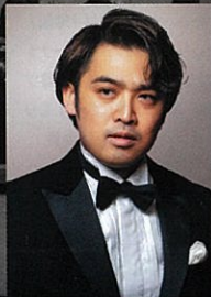
テノール 隠岐速人 Tenor: Hayato Oki