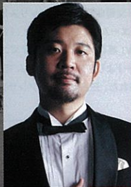
バリトン 高橋洋介 Bariton: Yosuke Takahashi