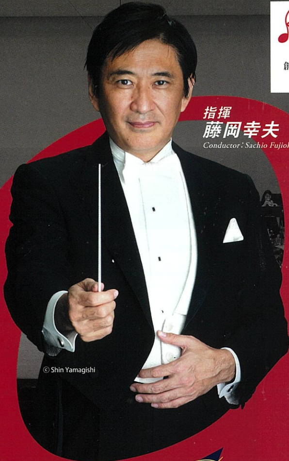
指揮 藤岡幸夫 Conductor: Sachio Fujioka