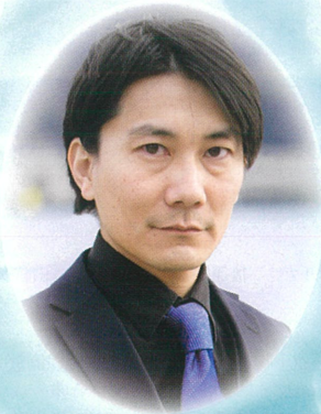
作曲 川上 統