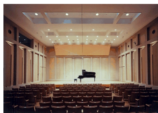
Xavier Recital Hall