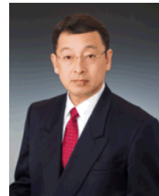
학장 KAWANO Yuji